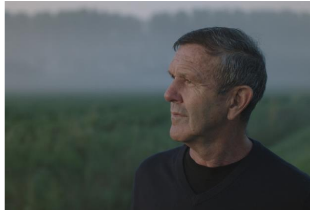
Roger De Vlaeminck

De Italiaan Francesco Moser was een van de grote namen van het Italiaanse wielrennen met overwinningen in de Primavera, het wereldkampioenschap, de Giro d'Italia en driemaal Parijs-Roubaix. Na zijn indrukwekkende carrière trok Moser zich terug in zijn wijngaarden. Maar smaakt zelfgemaakte wijn even zoet als het winnen van een klassieker?