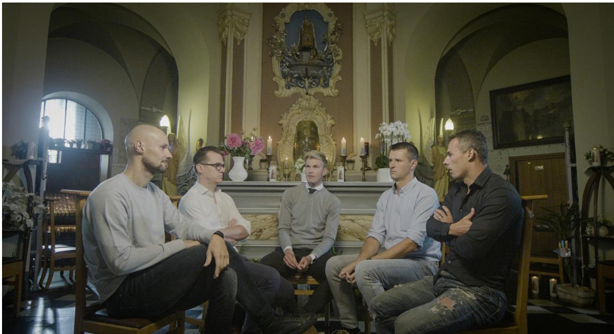
Tom Boonen, Nick Nuyens, Ruben Van Gucht, Staf Scheirlinckx, Bjorn Leukemans

In de beroemde kapel op de Muur van Geraardsbergen ontvangt Ruben Van Gucht vier hoofdrolspelers uit de Ronde van Vlaanderen van 2011. Gewezen boezemvrienden Nick Nuyens en Bjorn Leukemans getuigen over het stuklopen van hun vriendschap. Tom Boonen kijkt uit naar het leven na de koers. Staf Scheirlinckx heeft allang afscheid genomen van het wielrennen. George Hincapie, voormalig luitenant van Armstrong, toont ons zijn zakenimperium in Greenville, USA. Bjarne Riis, ploegleider van winnaar Nuyens, vertelt openlijk over de moeilijke jaren na zijn dopingbekentenis.