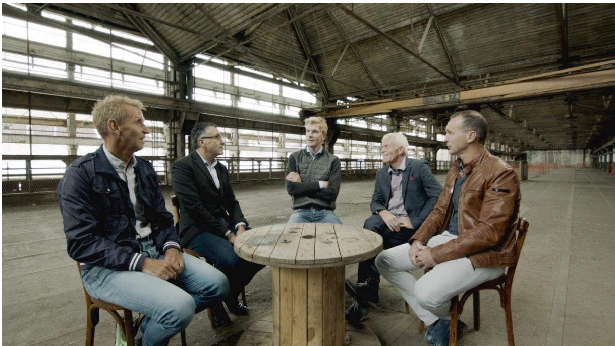
Steven Rooks, Eric Van Lancker, Ruben Van Gucht, Peter Winnen, Luc Roosen

In een verlaten fabriekspand in Luik verzamelt Ruben voor deze laatste aflevering vier hoofdrolspelers van de editie 1990 van Luik-Bastenaken-Luik: winnaar Eric Van Lancker, Luc Roosen, Peter Winnen en Steven Rooks. Voor de reportages trok Ruben naar Italië, waar hij gastvrij werd ontvangen door Gianni Bugno en Moreno Argentin, respectievelijk zesde en zevende in de wedstrijd.